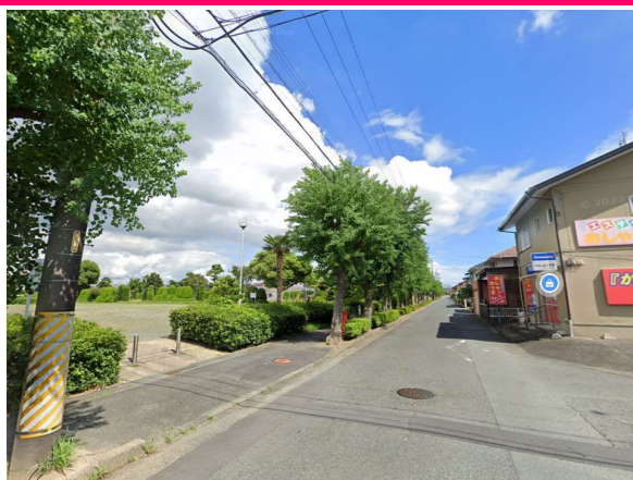
⑧南上ノ原公園 南側出入口