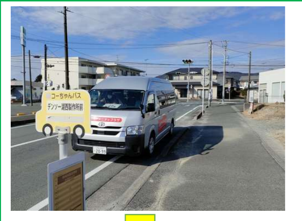
⑧デンソー湖西製作所前